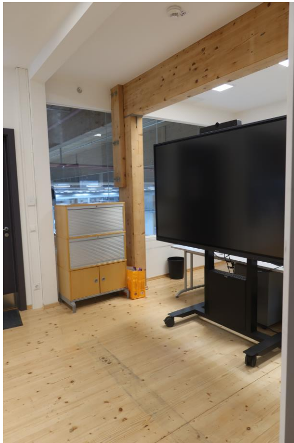
Halle 4 (Blechhalle), Halle 3 (Assembling), Halle 5 (ehemalige Säge)