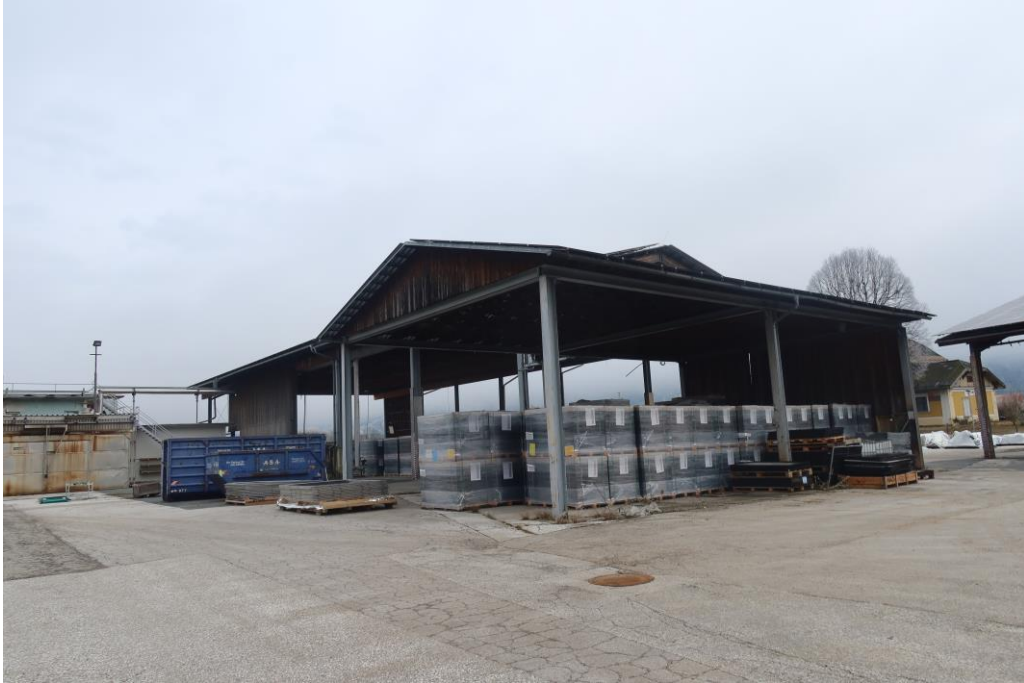
Halle 3 (Assembling)