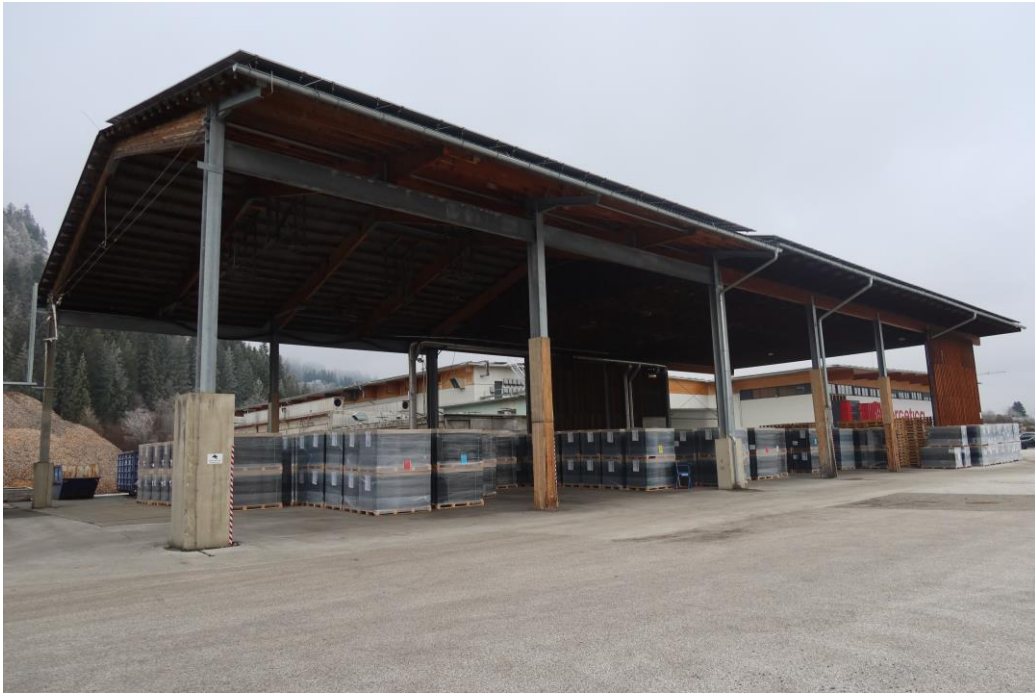
Halle 5 (ehemalige Säge)