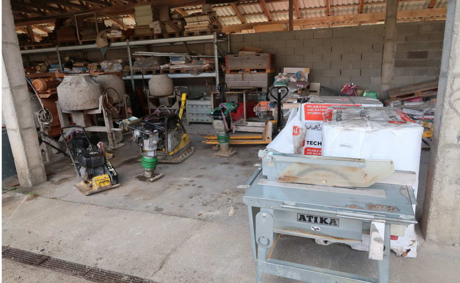
GERÄTE - HALLE