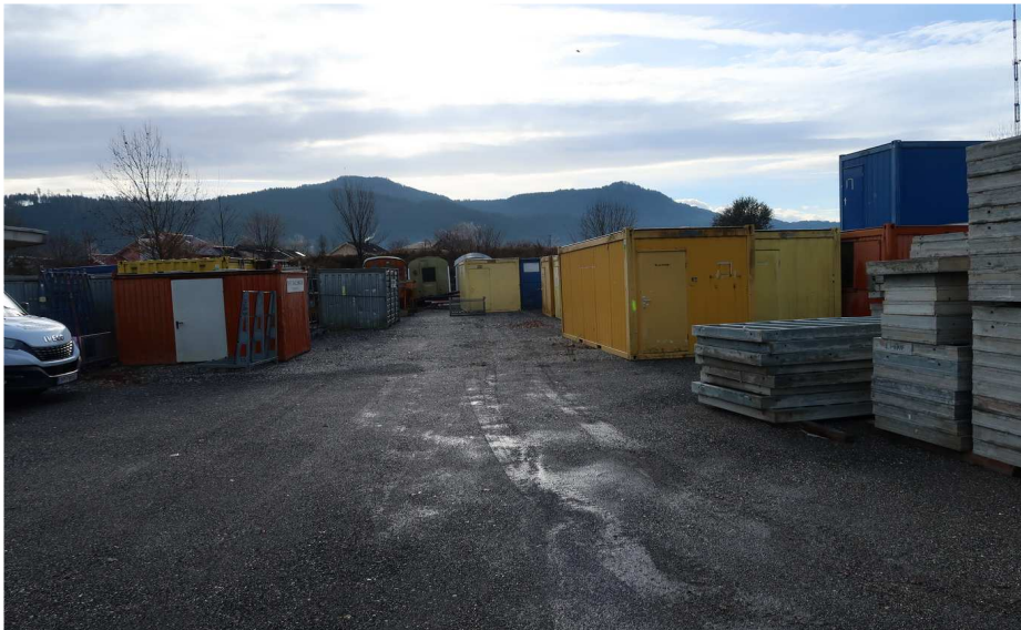
FREILAGER - OST