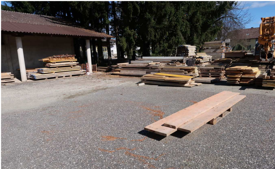
FREILAGER - MITTE