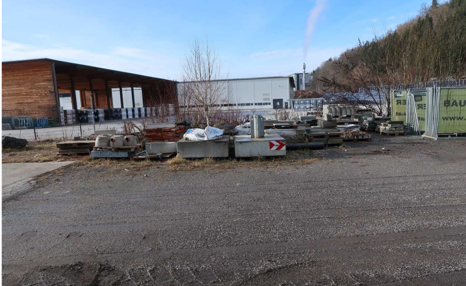
FREILAGER - SÜD