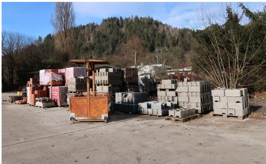
GERÜST - HALLE