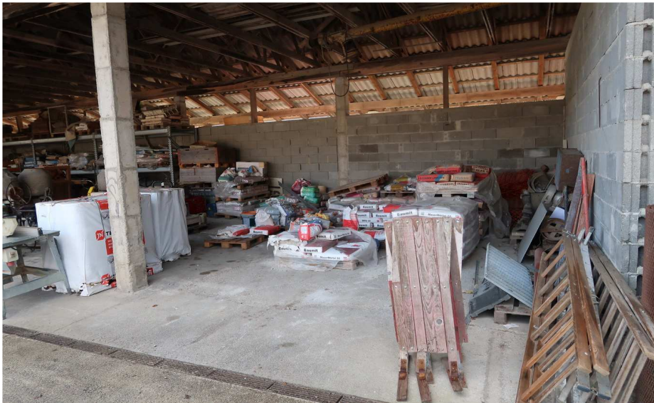
GERÄTE - HALLE