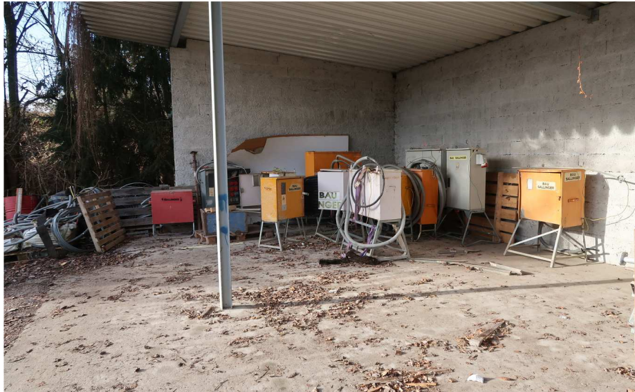
GERÜST - HALLE