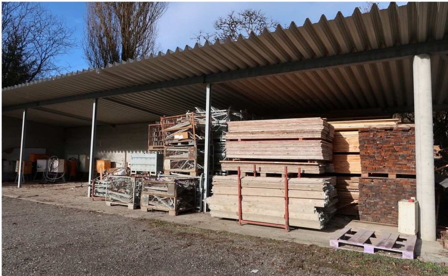
GERÜST - HALLE