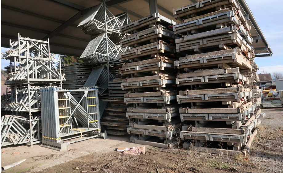
HALLE - NEU