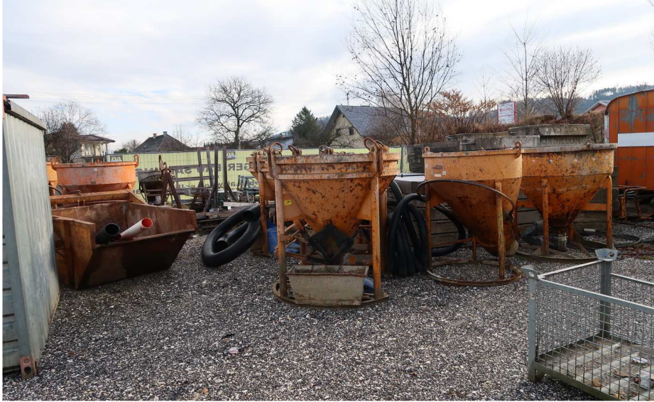
FREILAGER - OST