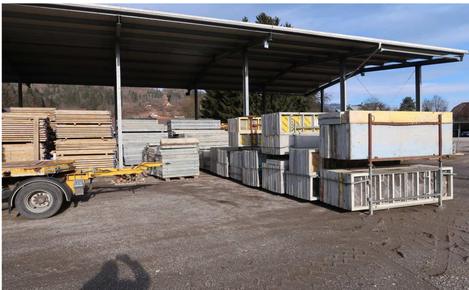
HALLE - NEU