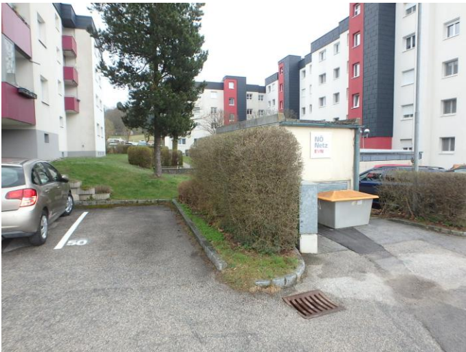
zugeordneter Stellplatz Nr. 50