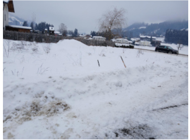
Sicht nach Norden zur „Alten Bundesstraße“