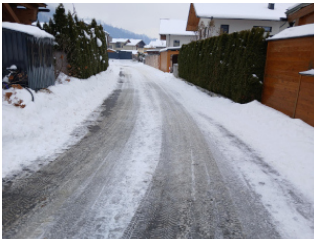
Aufschließungsstraße Gst 366/112, 521, nach Norden