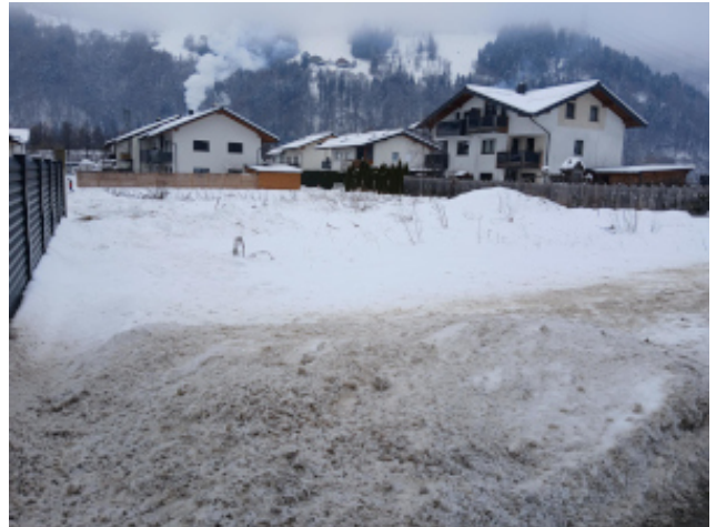
Sicht von der „Alten Bundesstraße nach EZ Westen