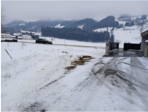
Sicht von der Aufschließungsstraße nach Osten