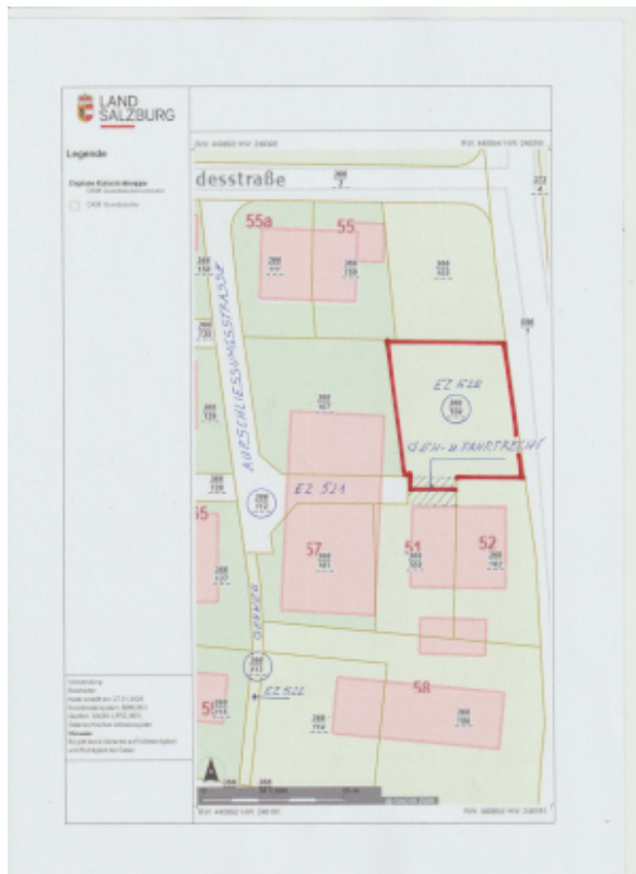
Lageplan, ohne Maßstab