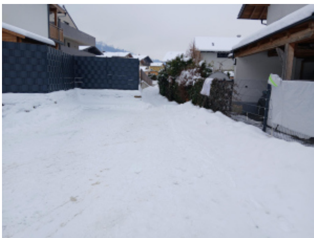
Gehweg, Gst. 366/113, EZ 522, von der Aufschließungsstraße nach Süden