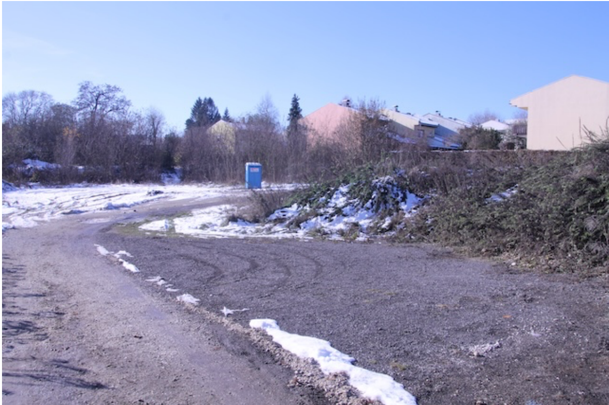
Nicht verbaute Fläche