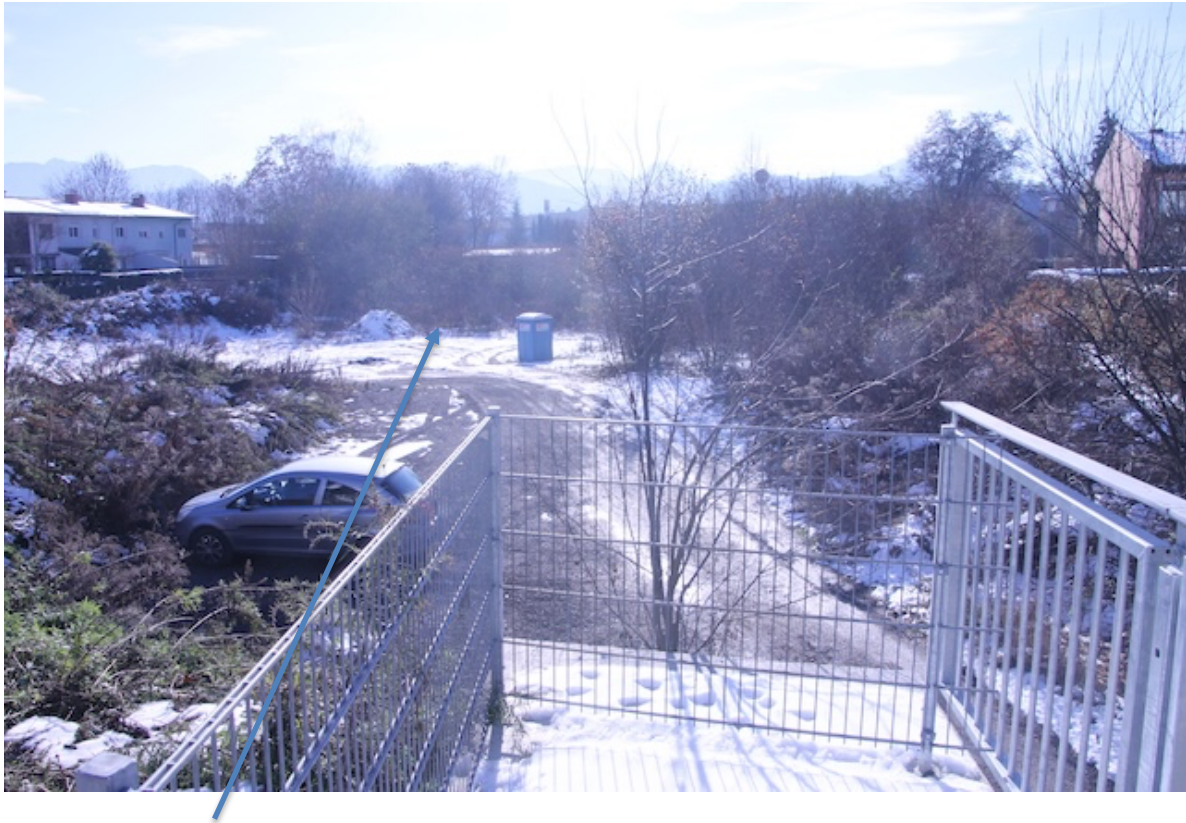
Nicht verbaute Fläche