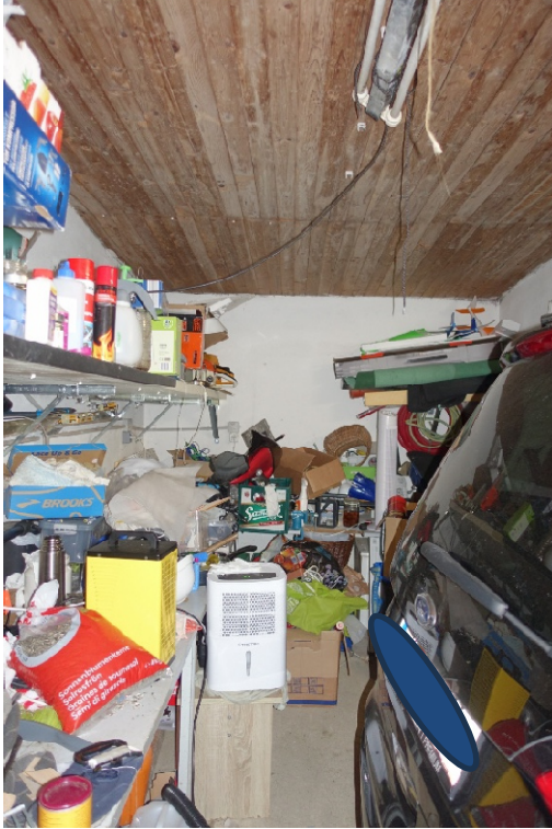
GARAGE - FOTO 52