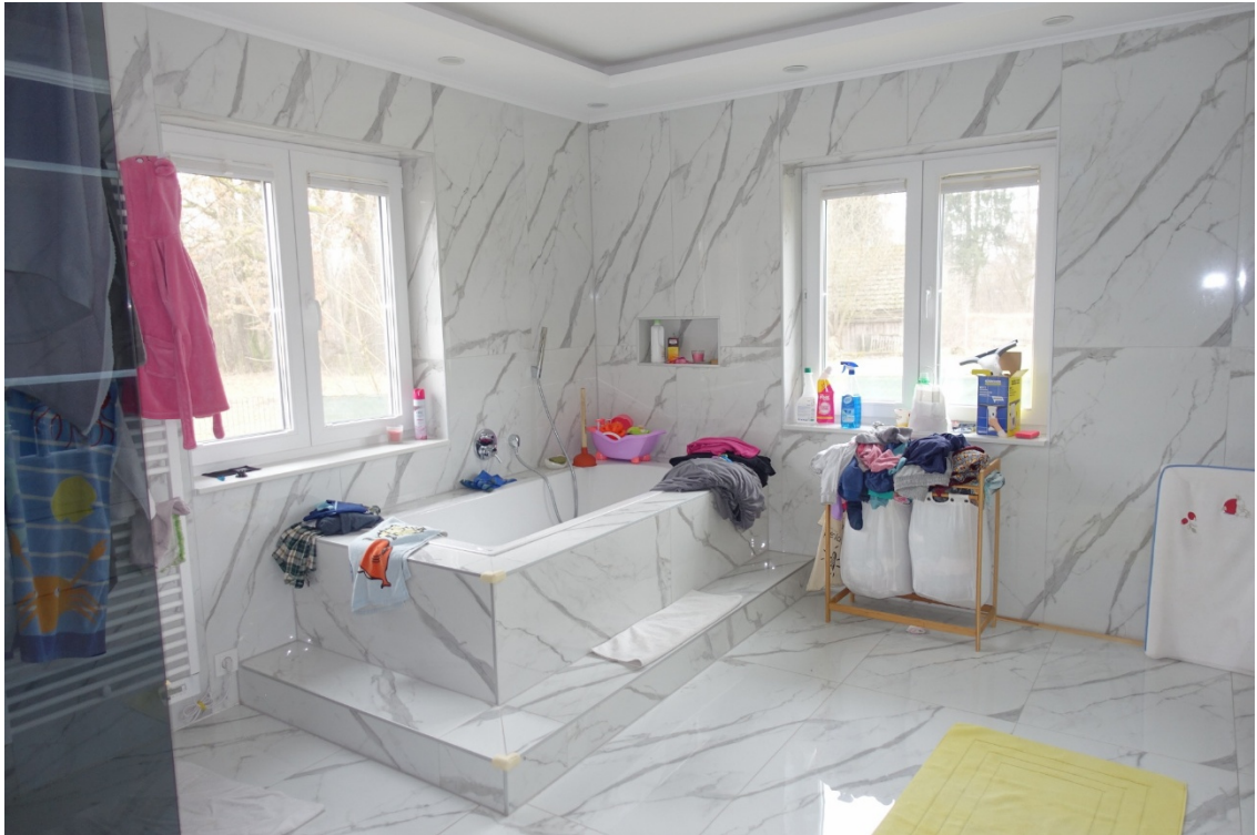
BADEZIMMER - FOTO 28