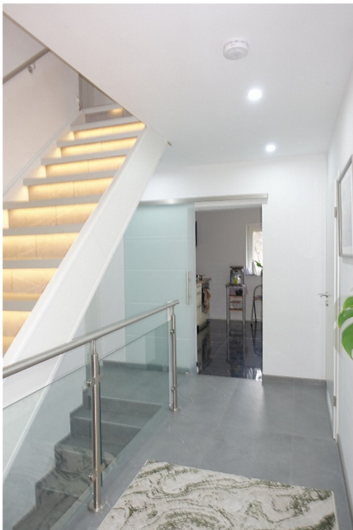
DIELE - FOTO 20