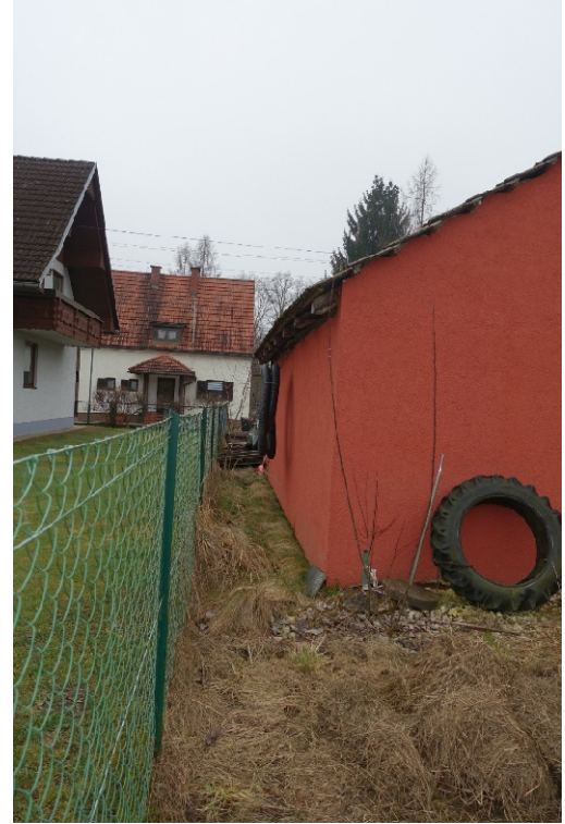
OSTANSICHT - FOTO 47