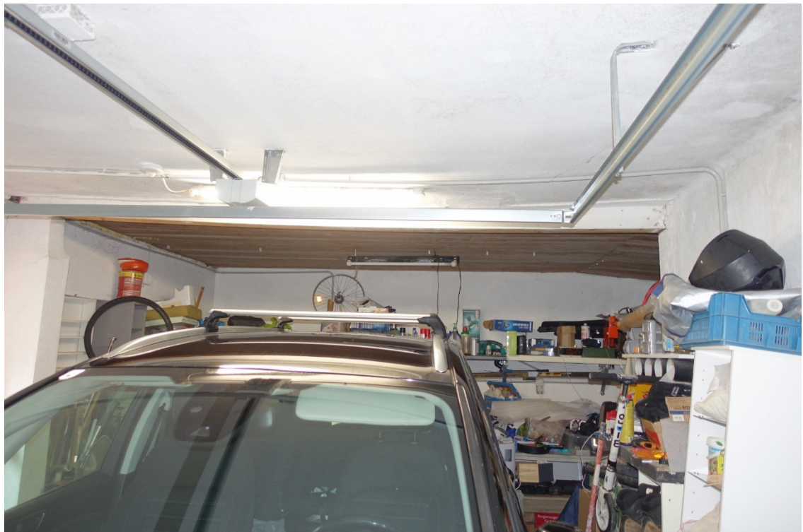
GARAGE - FOTO 48