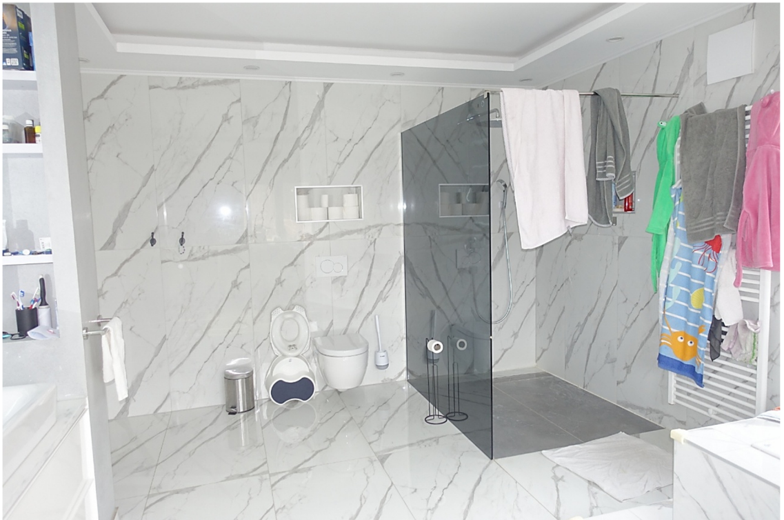
BADEZIMMER - FOTO 27