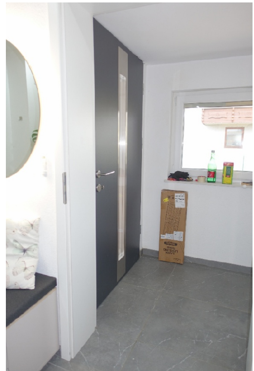
WINDFANG - FOTO 17