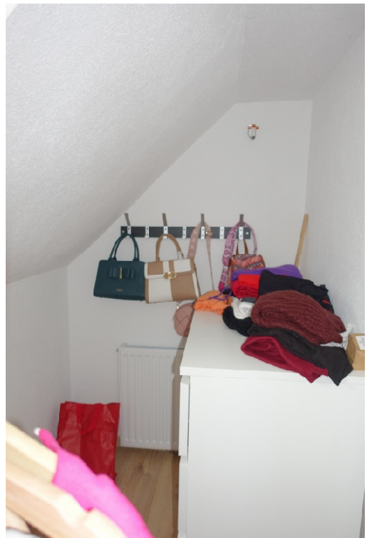
ABSTELLRAUM - FOTO 42