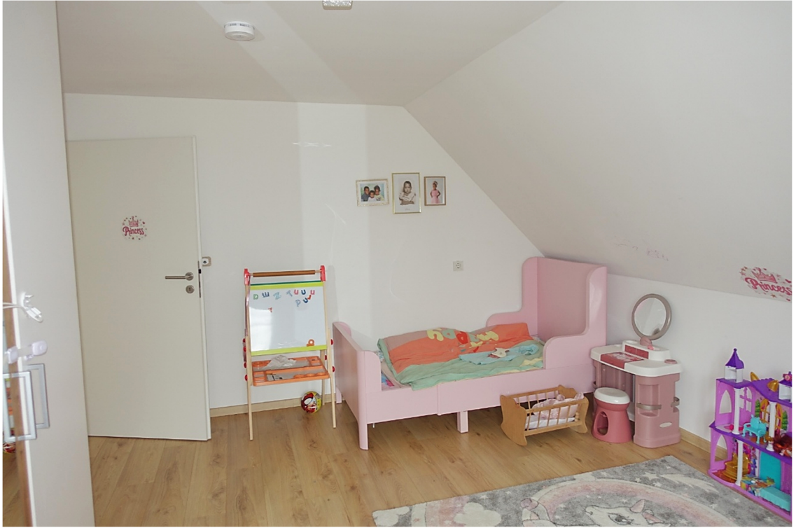
ZIMMER 2 - FOTO 36