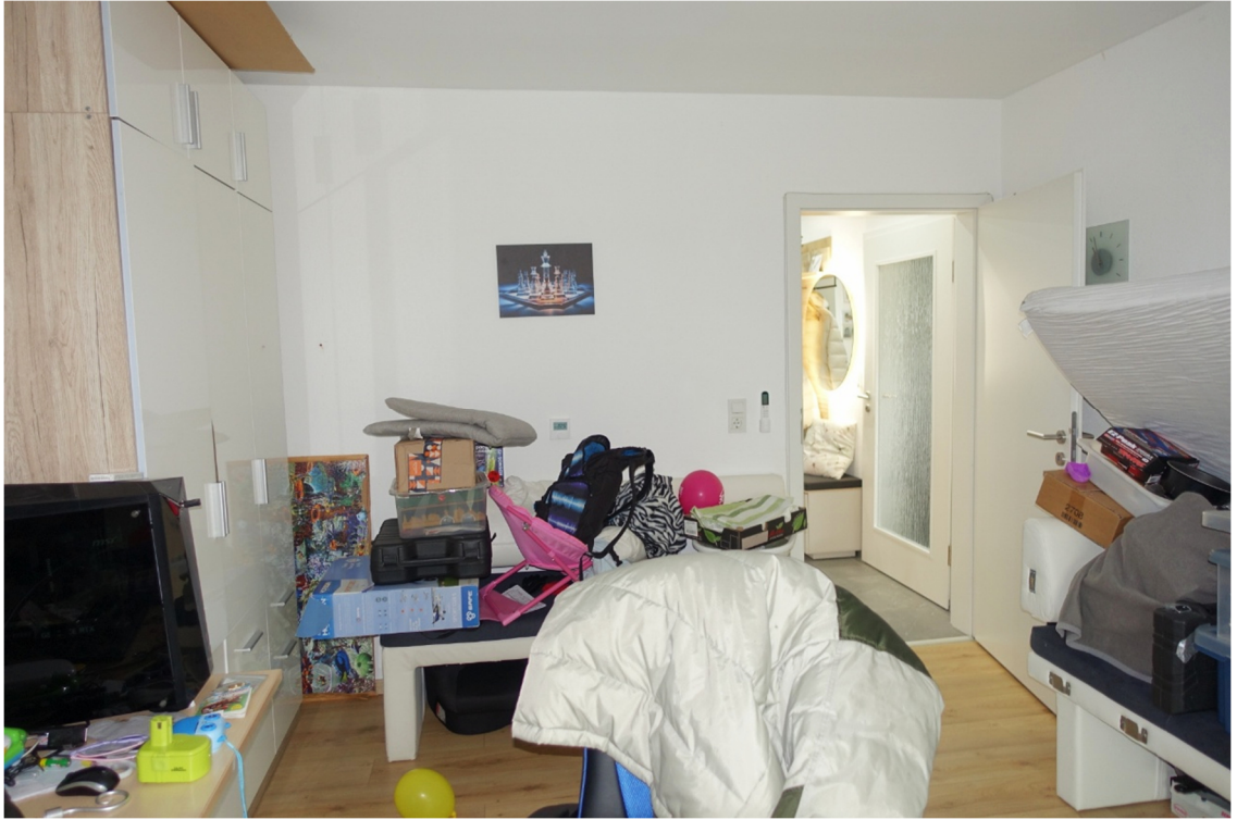
ZIMMER - FOTO 30