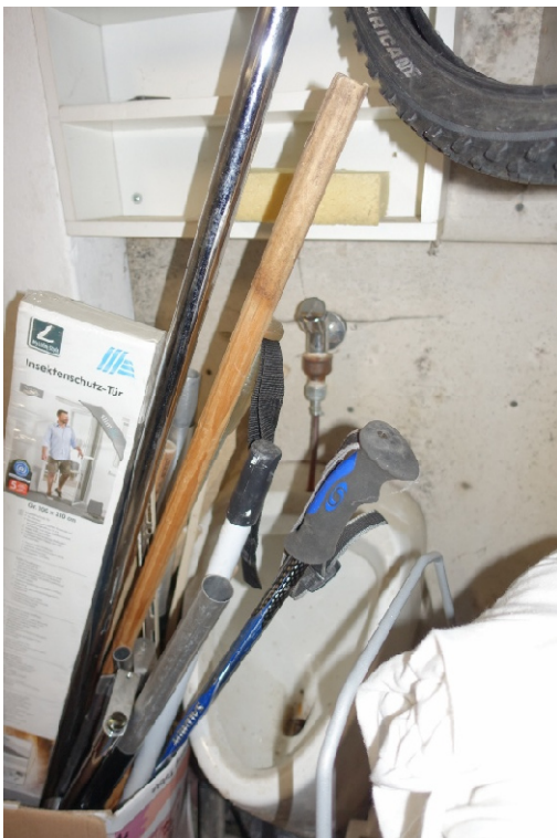
GARAGE - FOTO 50