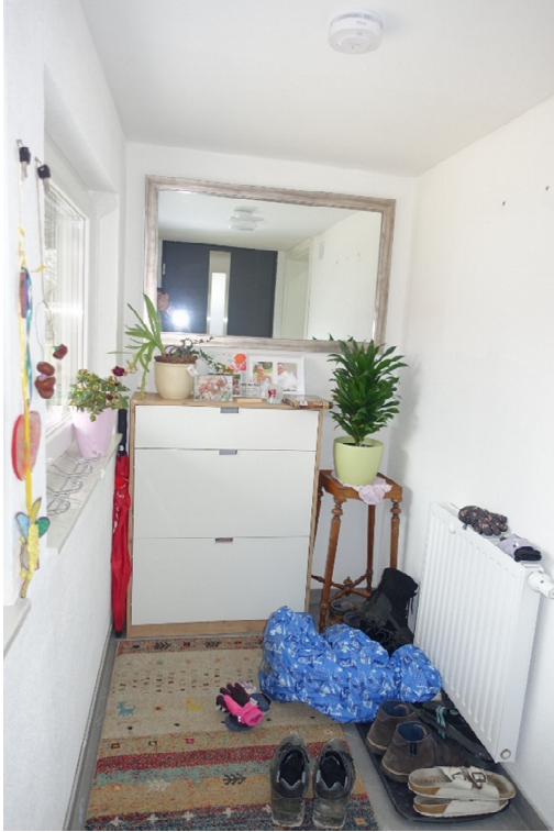
WINDFANG - FOTO 18