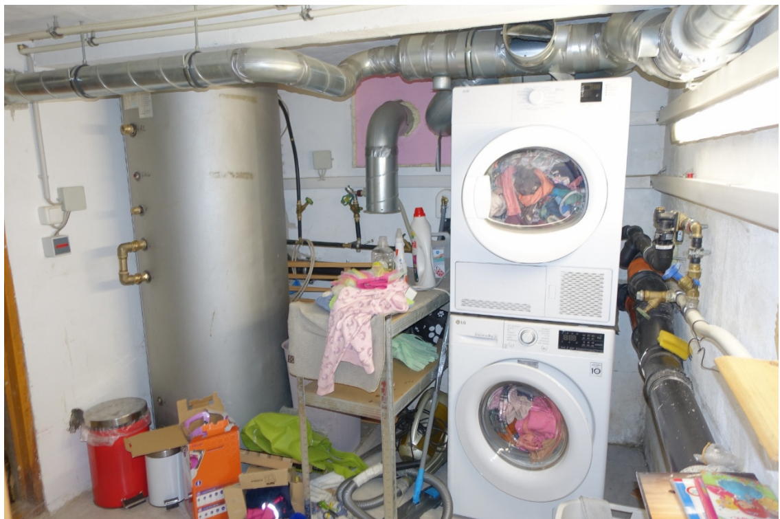
KELLERRAUM 2 - FOTO 12