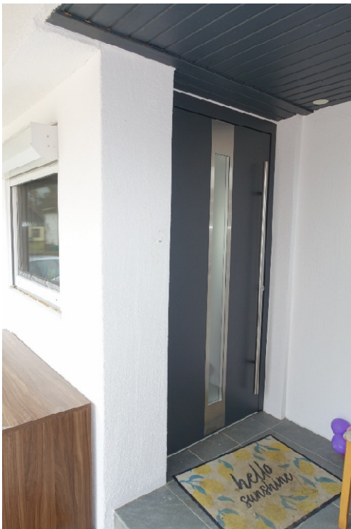
HAUSEINGANG - FOTO 16