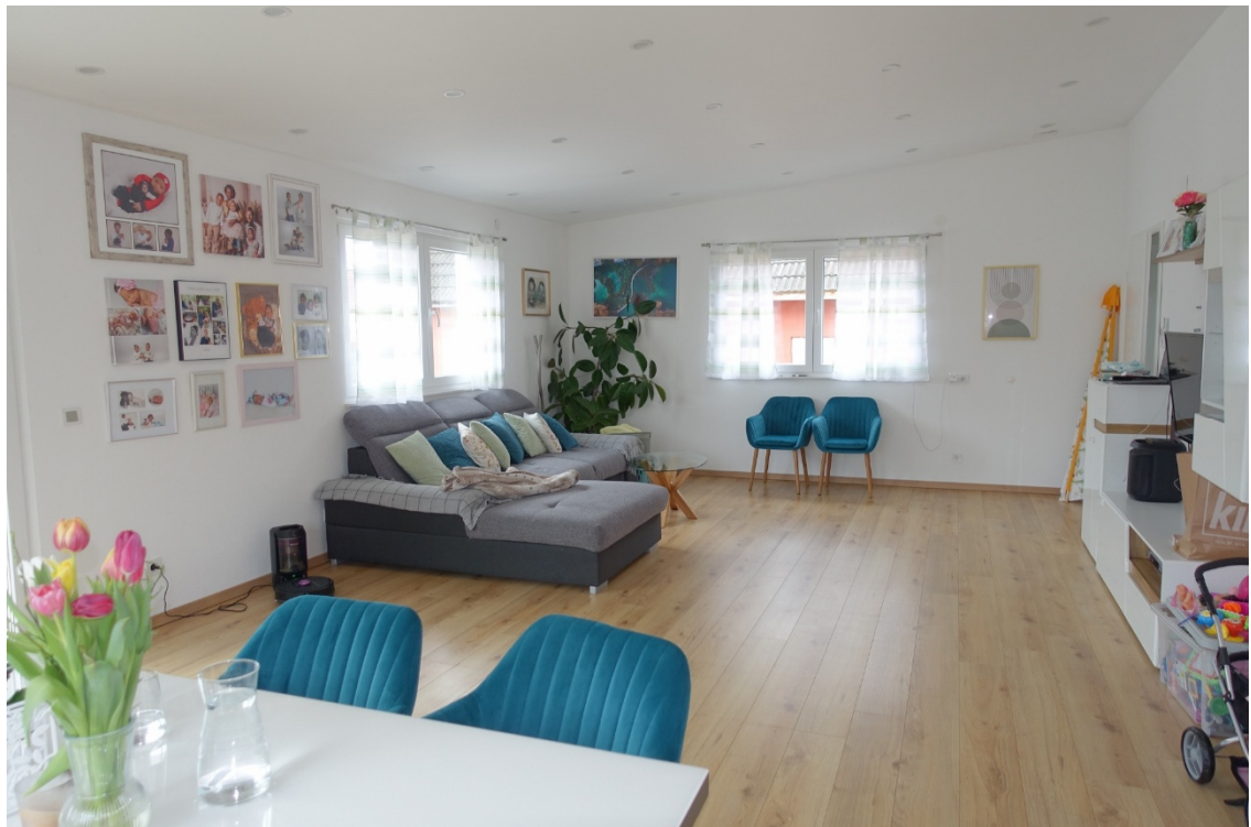
WOHNRAUM/ZUBAU - FOTO 23