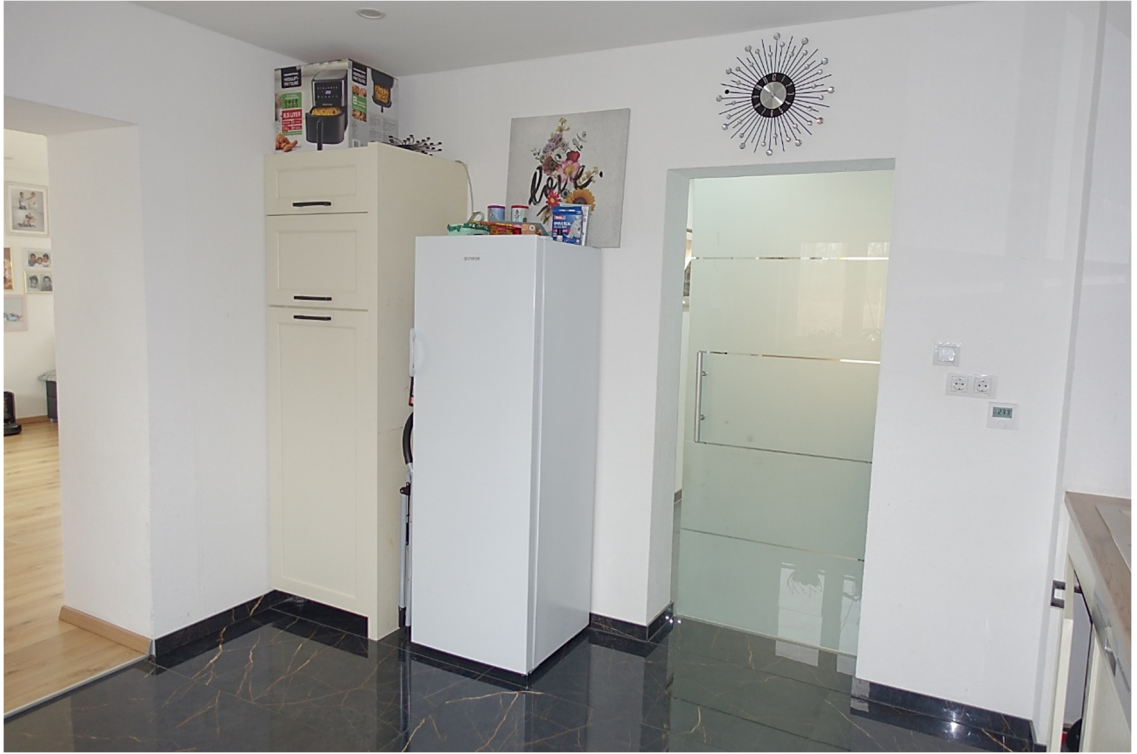
KÜCHE - FOTO 26