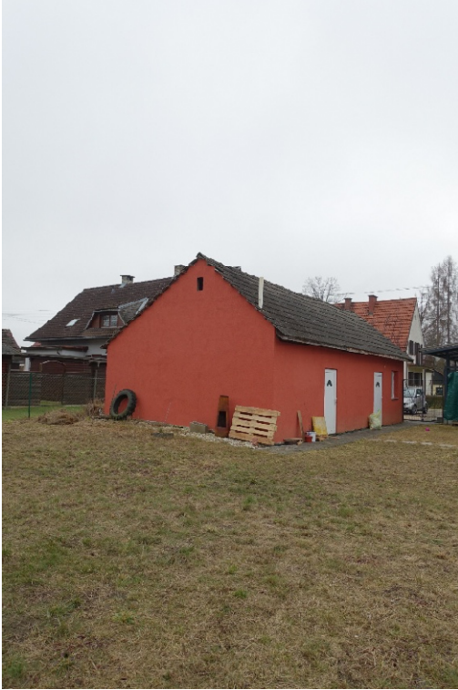
NORD-WESTANSICHT - FOTO 46