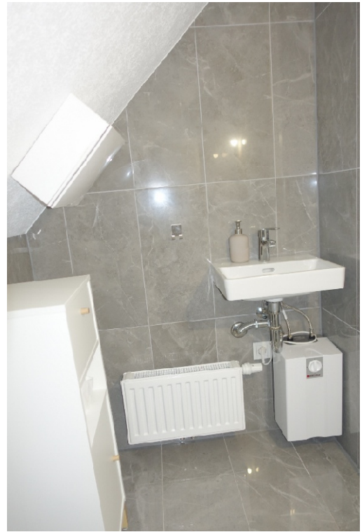
WC - FOTO 44