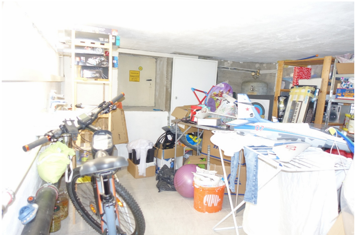
KELLERRAUM 1 -FOTO 10