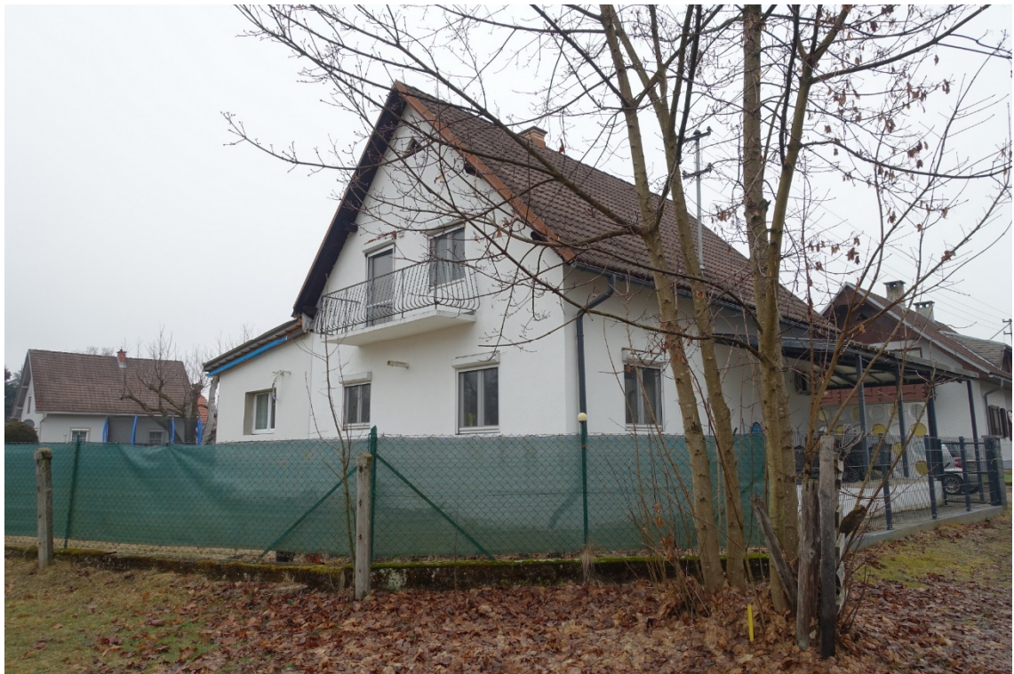
SÜD-WESTANSICHT - FOTO 2