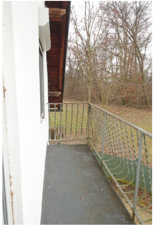
BALKON - FOTO 40