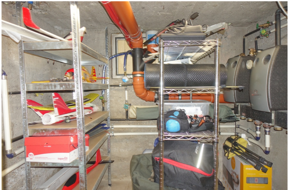
HEIZRAUM - FOTO 14