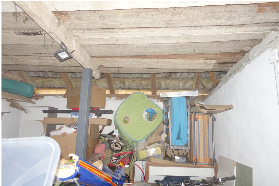
LAGERRAUM - FOTO 58