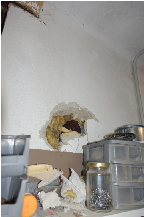
GARAGE - FOTO 54