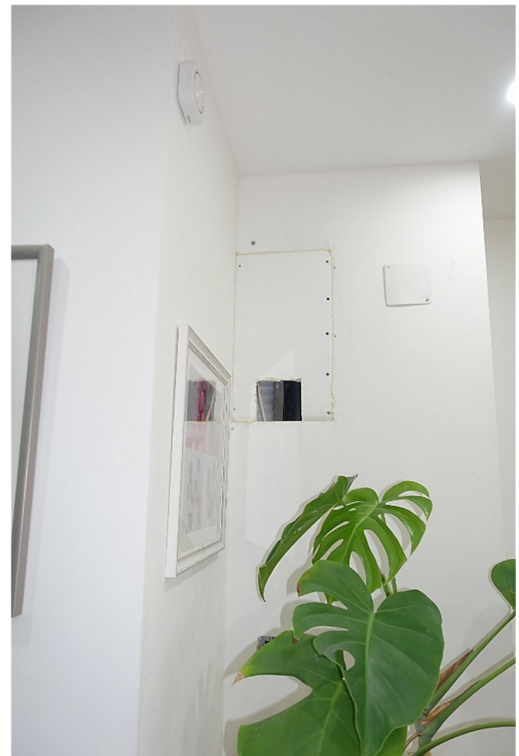
DIELE - FOTO 21