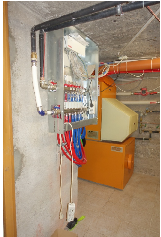
HEIZRAUM - FOTO 13