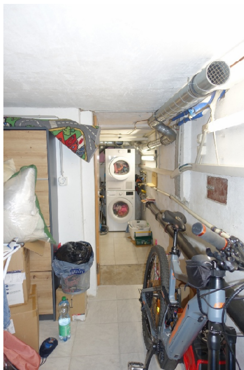
KELLERRAUM 1 - FOTO 8