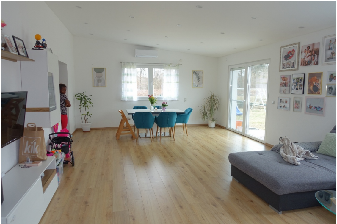
WOHNRAUM/ZUBAU - FOTO 24