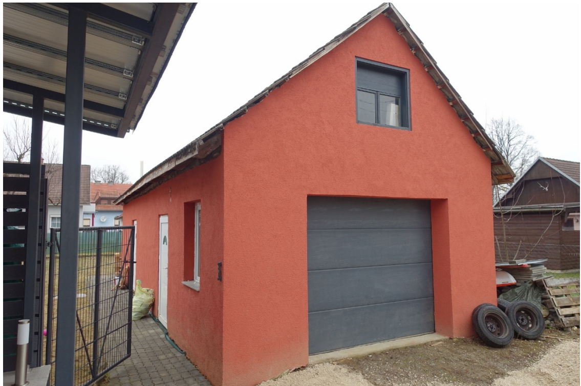
SÜD-WESTANSICHT - FOTO 45