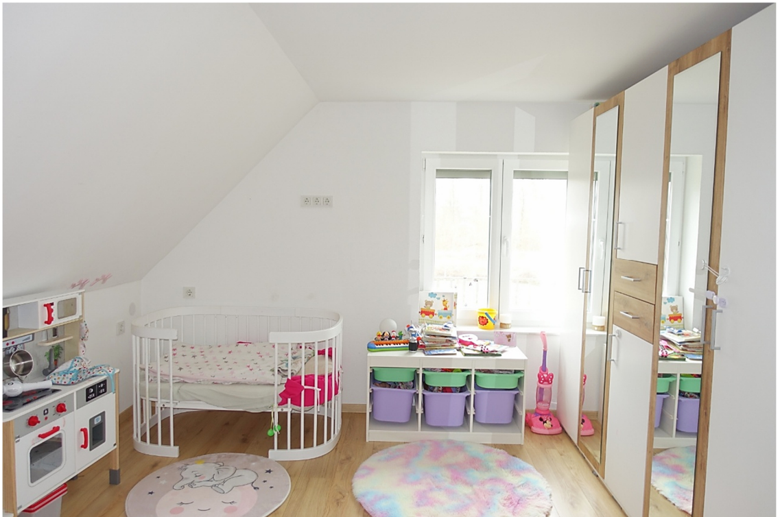
ZIMMER 2 - FOTO 37