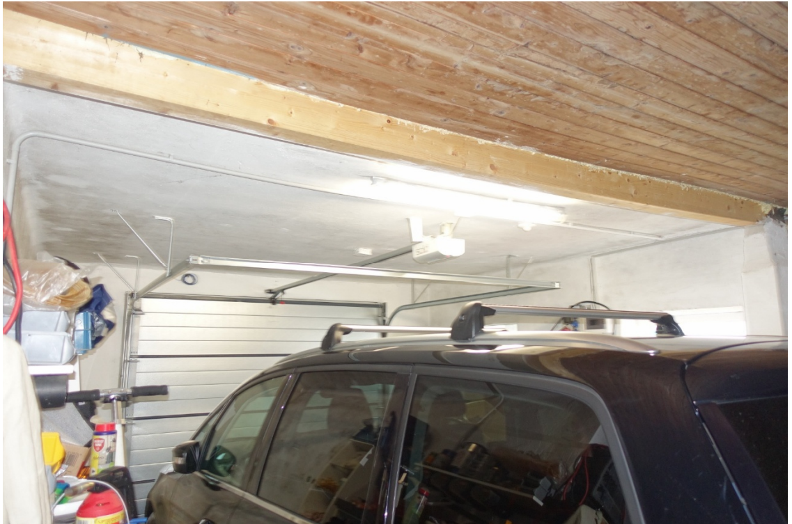
GARAGE - FOTO 49