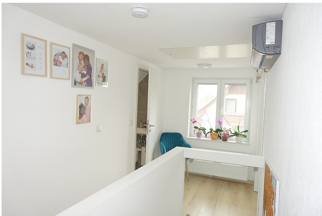
VORRAUM - FOTO 33