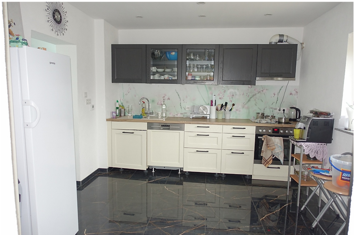
KÜCHE - FOTO 25