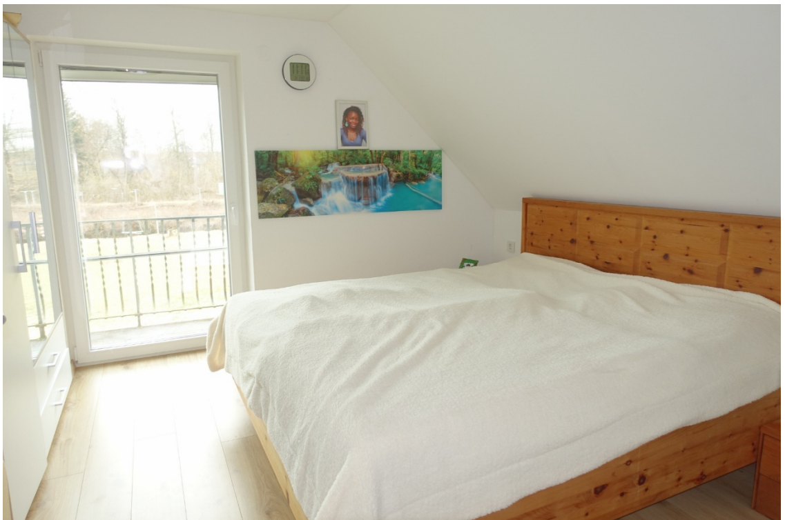
ZIMMER 3 - FOTO 39