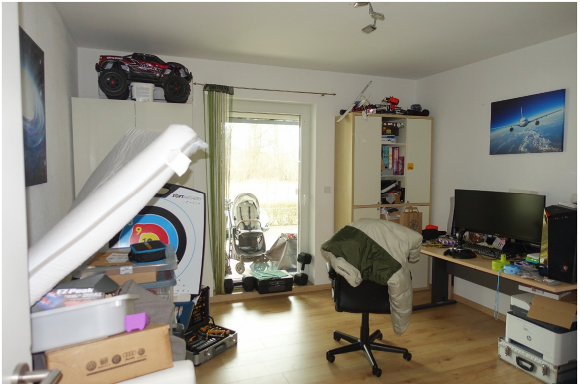
ZIMMER - FOTO 31