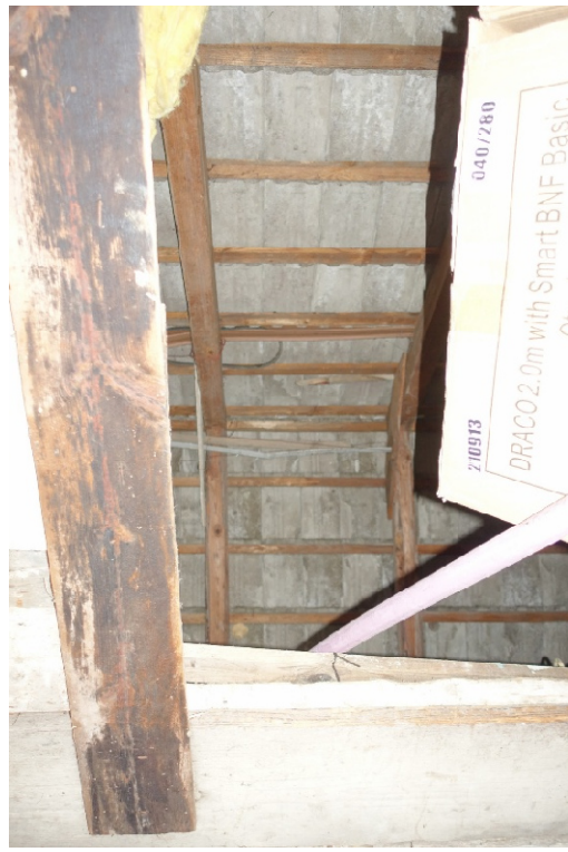
LAGERRAUM/DACHBODEN - FOTO 57