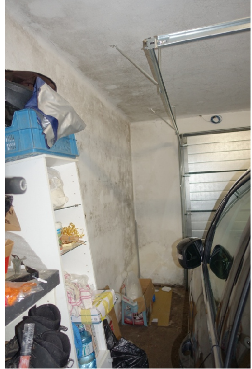
GARAGE - FOTO 53