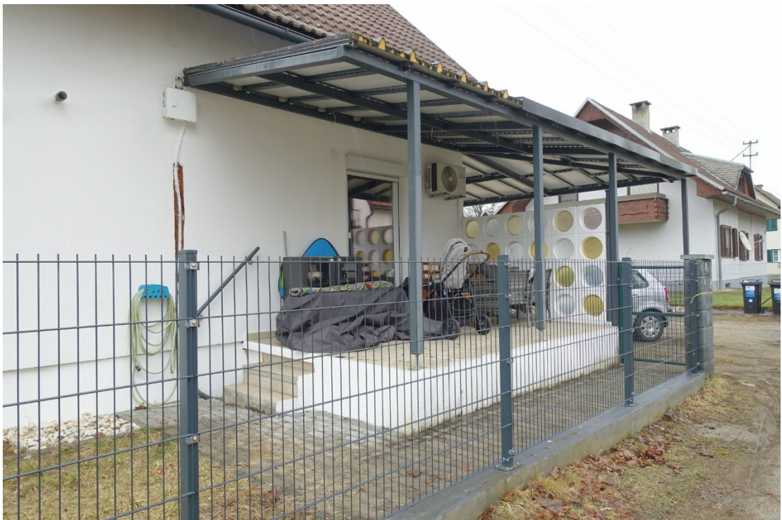
TERRASSE-SÜD - FOTO 62