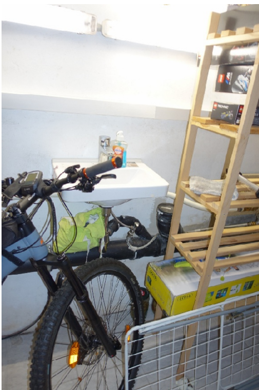
KELLERRAUM 1 - FOTO 7