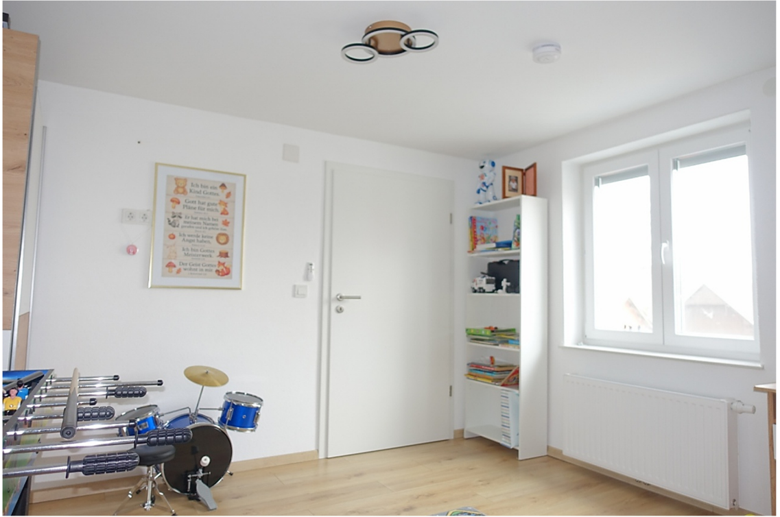
ZIMMER 1 - FOTO 34