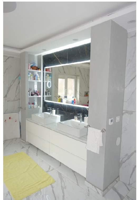
BADEZIMMER - FOTO 29