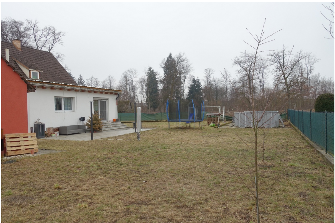
NÖRDLICHE GARTENFLÄCHE MIT TERRASSE - FOTO 60