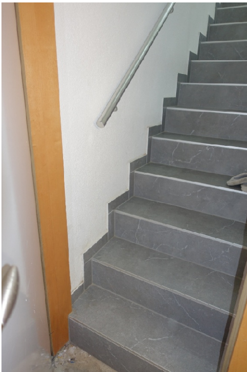
KELLERTREPPE - FOTO 5