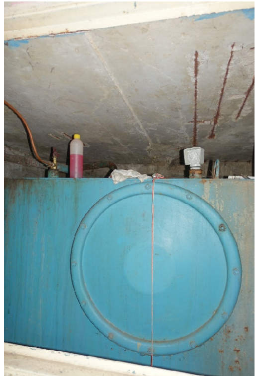
ÖLLAGERRAUM - FOTO 11