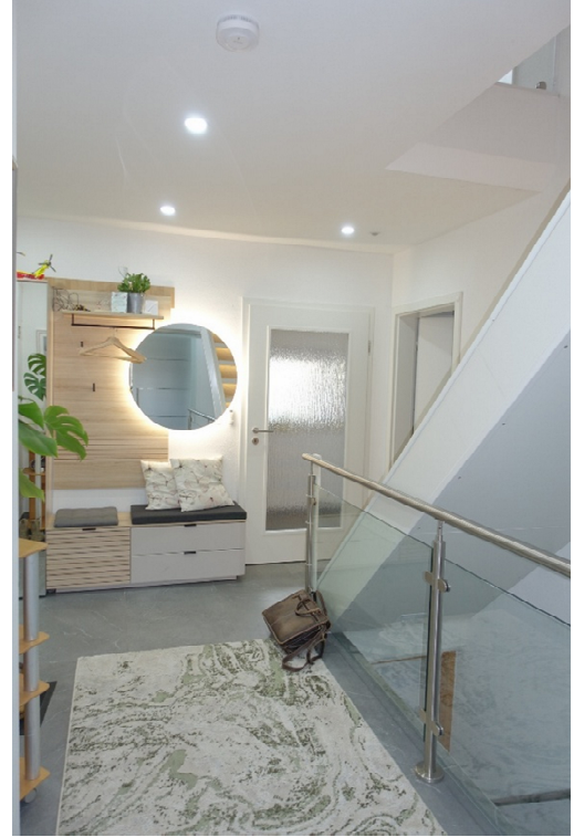
DIELE - FOTO 19