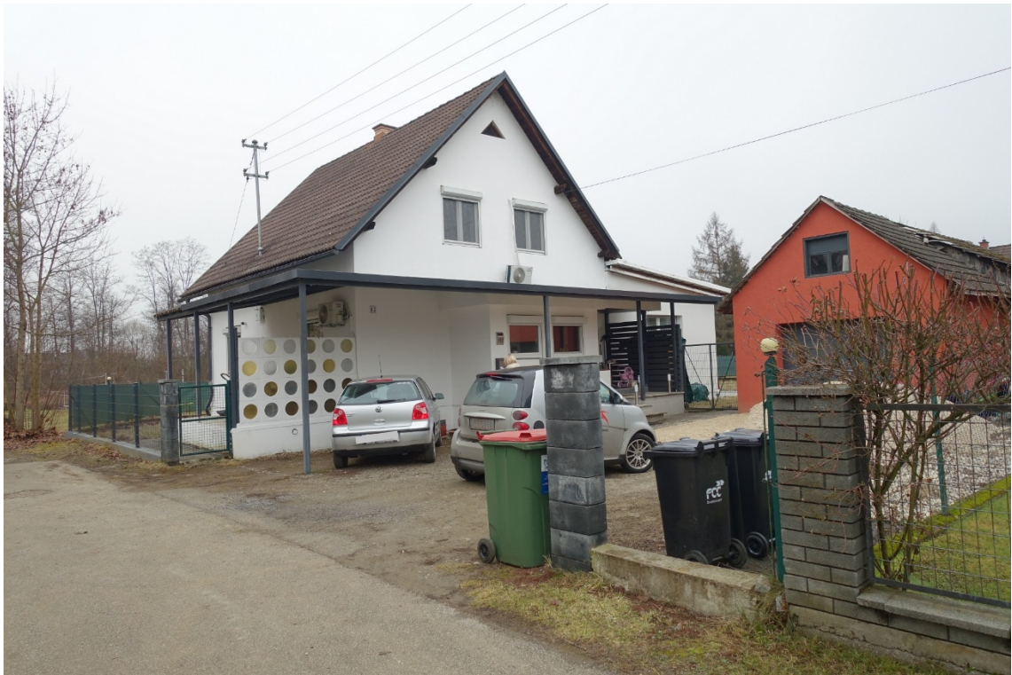
SÜD-OSTANSICHT - FOTO 1