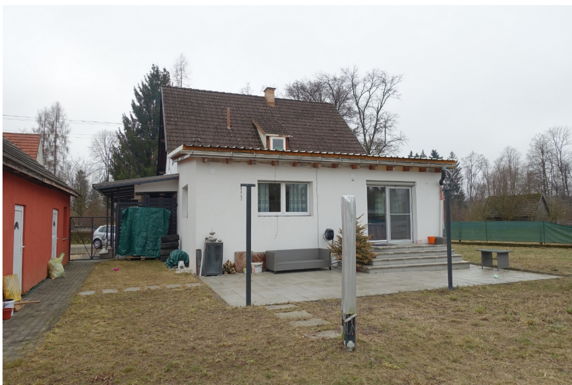
NORD-OSTANSICHT - FOTO 4