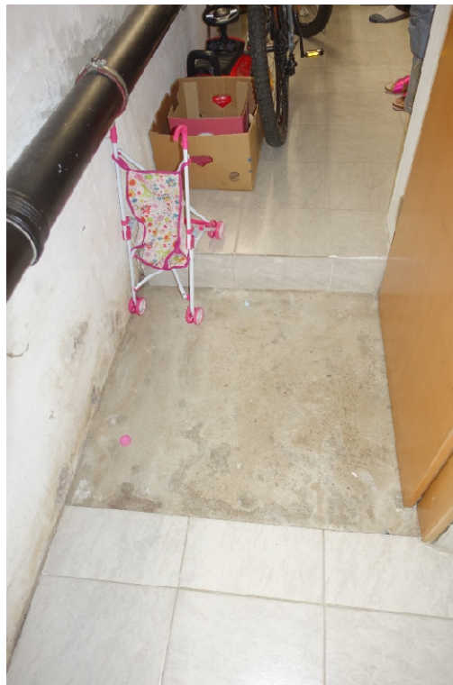
BODEN ZW. K1 UND K2 - FOTO 6