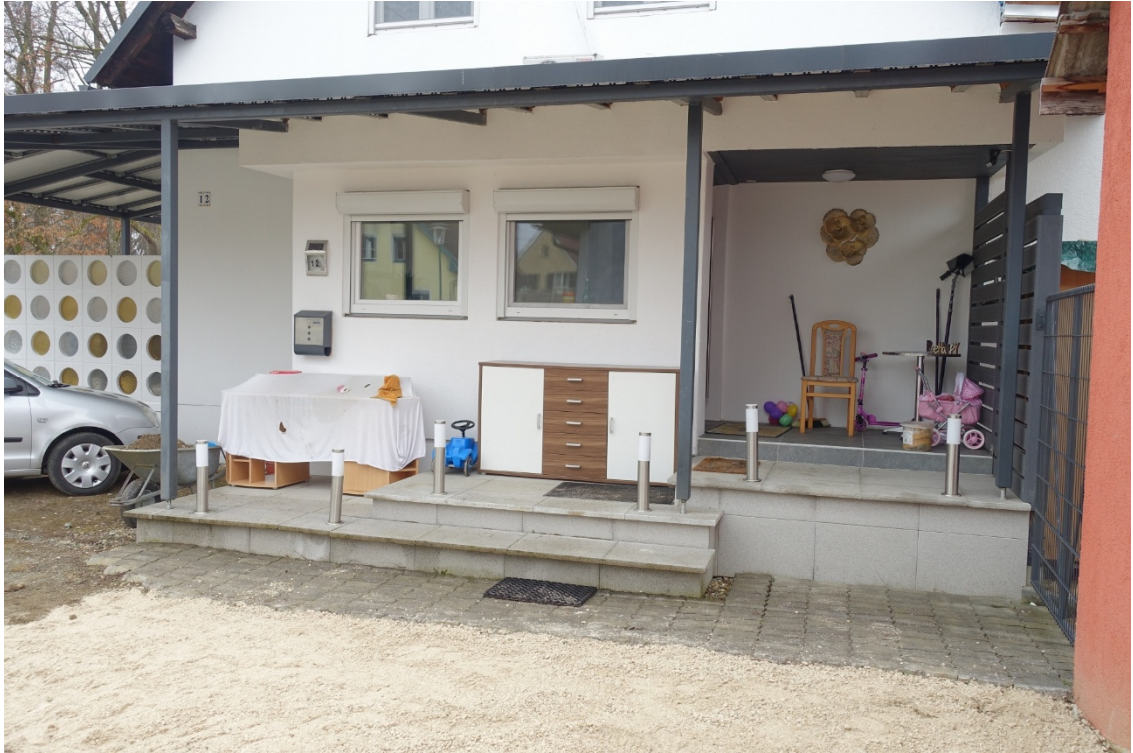
HAUSEINGANG - FOTO 15