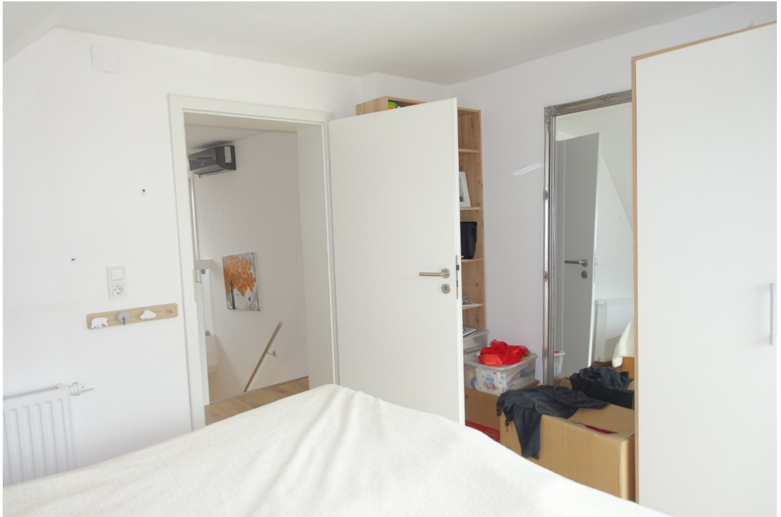
ZIMMER 3 - FOTO 38