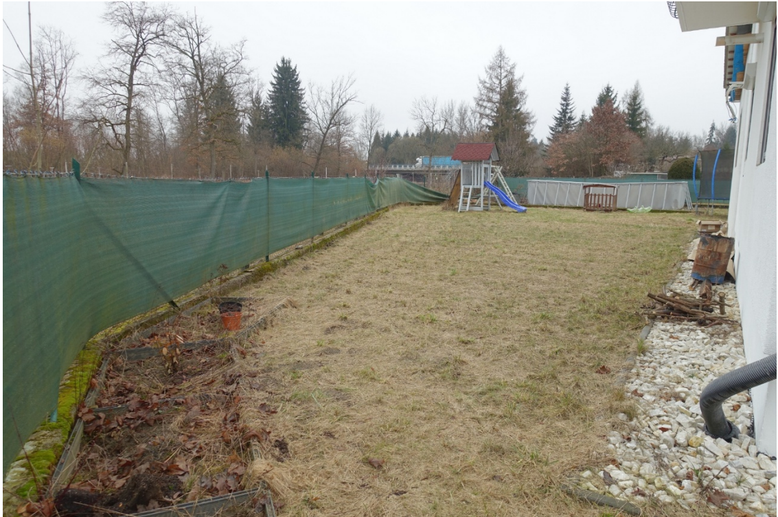
WESTLICHE GARTENFLÄCHE - FOTO 61