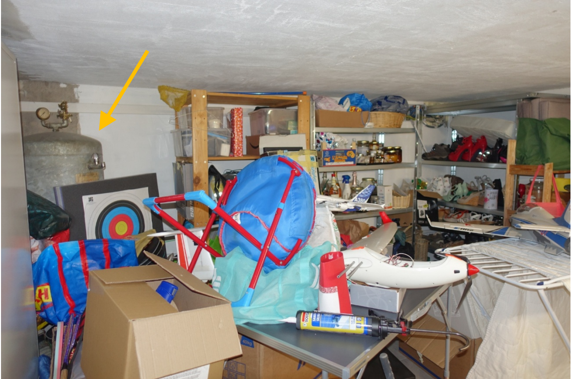
KELLERRAUM 1 -FOTO 9