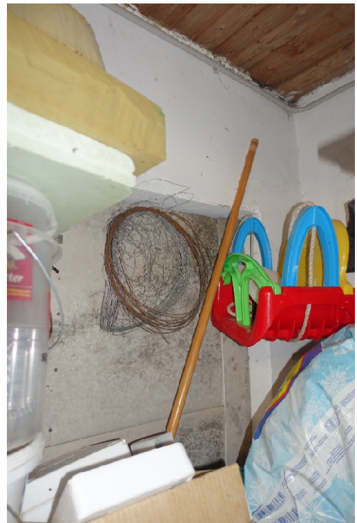
GARAGE - FOTO 55