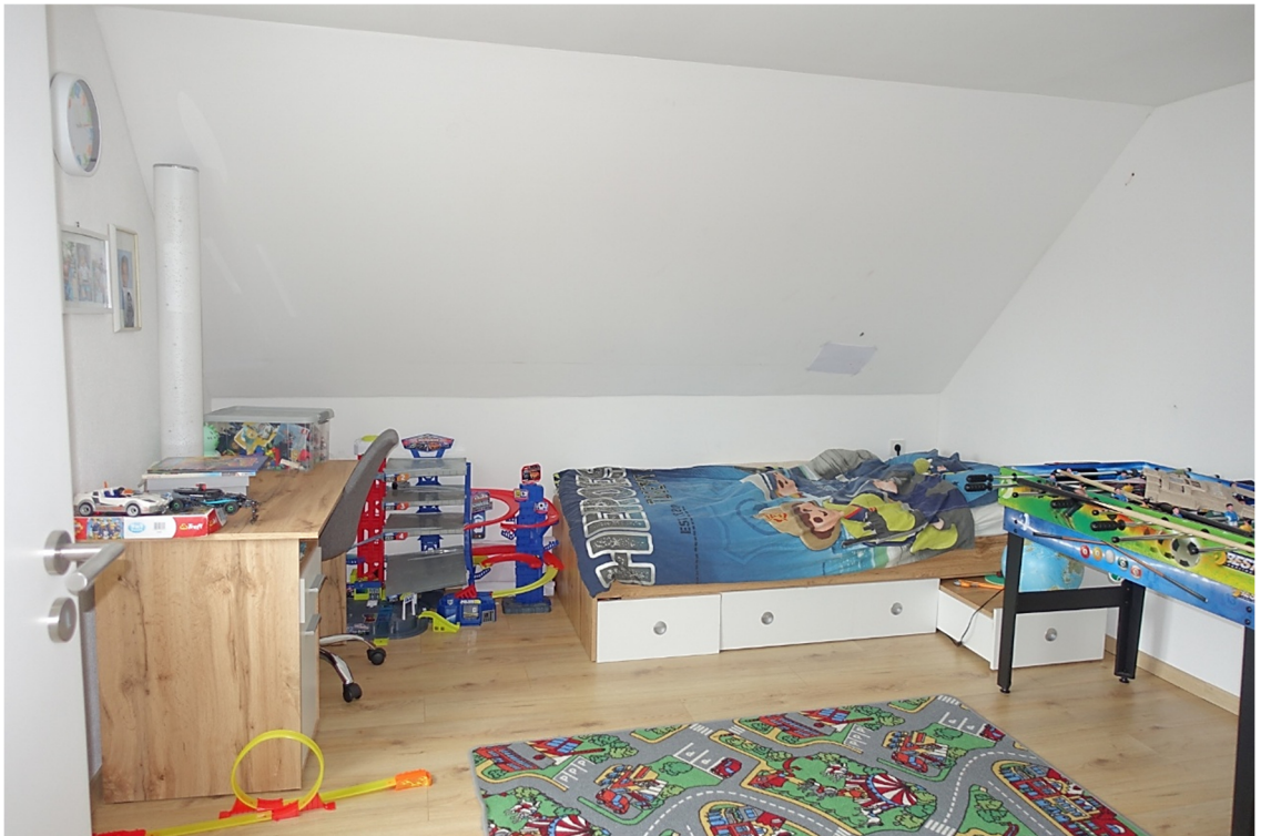
ZIMMER 1 - FOTO 35