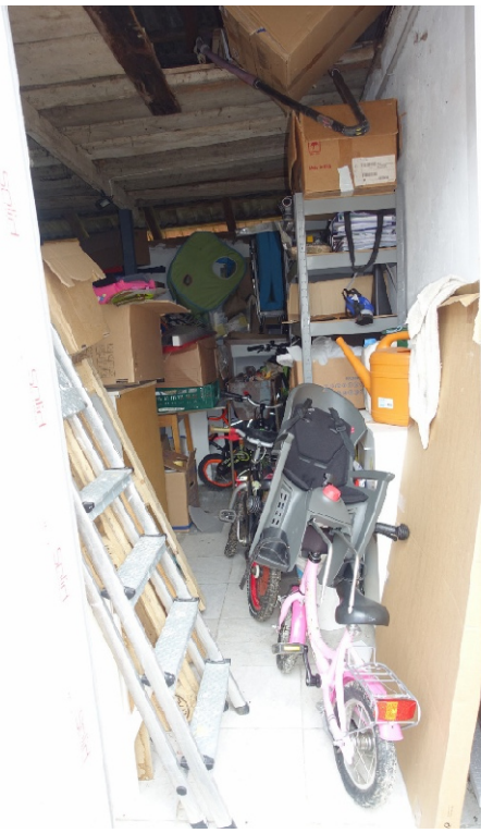
LAGERRAUM - FOTO 56