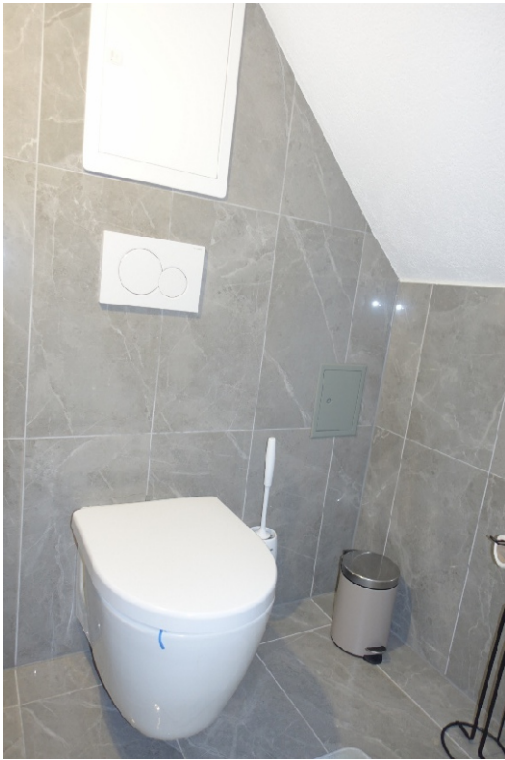
WC - FOTO 43