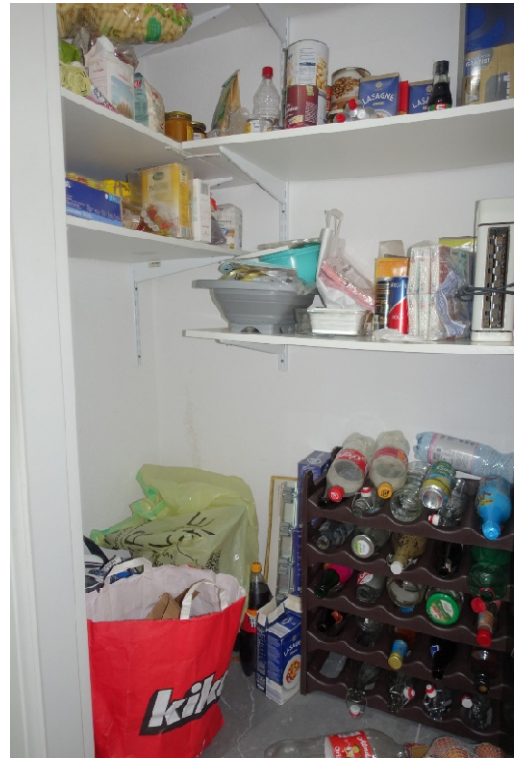
SPEIS - FOTO 22