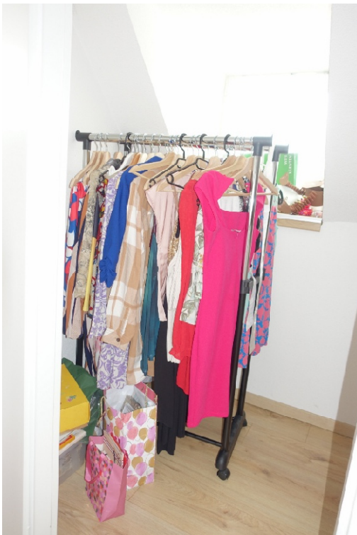
ABSTELLRAUM - FOTO 41