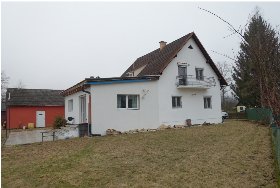
NORD-WESTANSICHT - FOTO 3