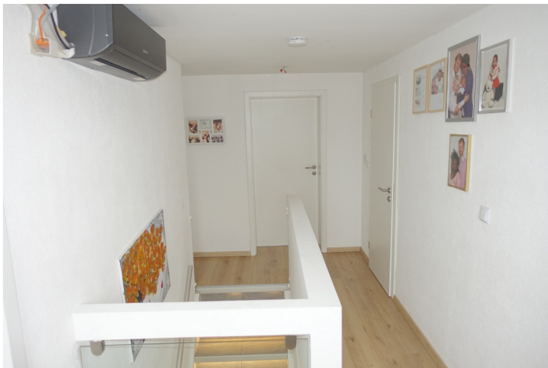
VORRAUM - FOTO 32