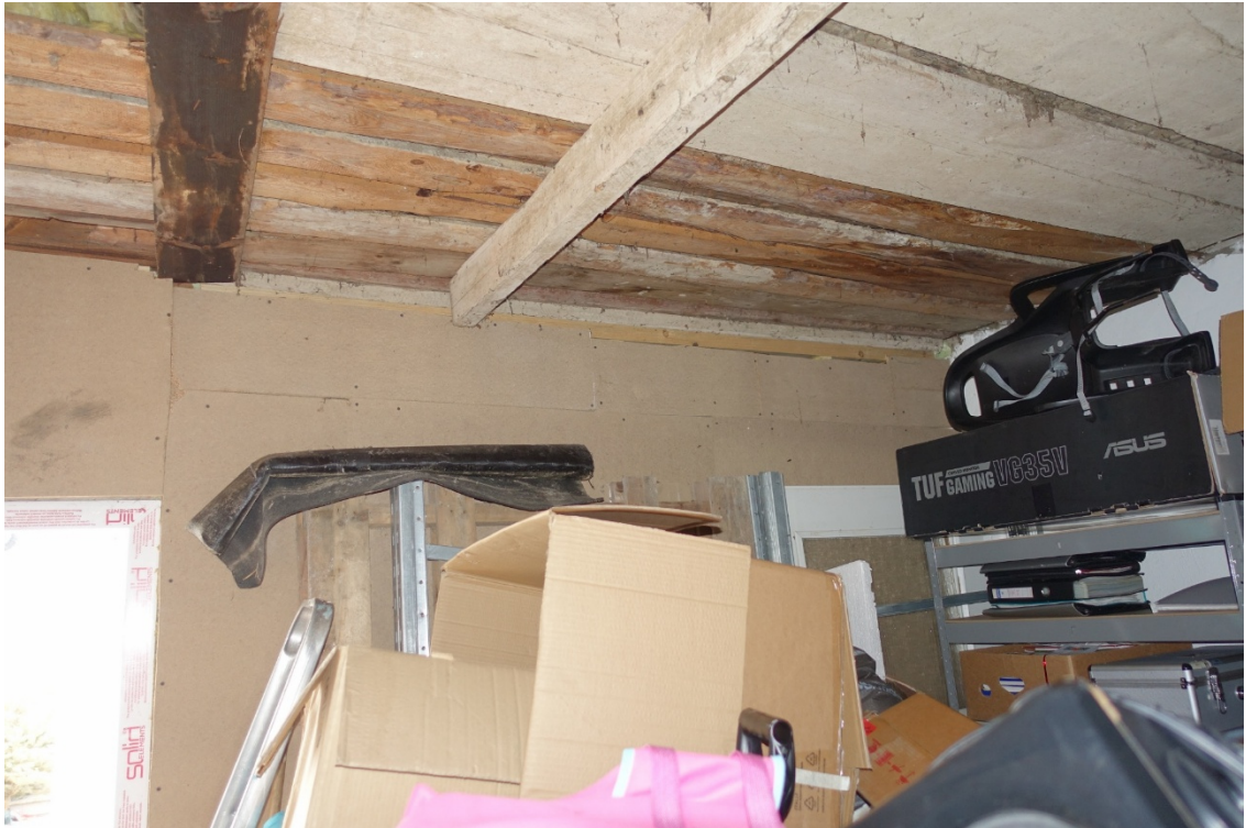
LAGERRAUM - FOTO 59